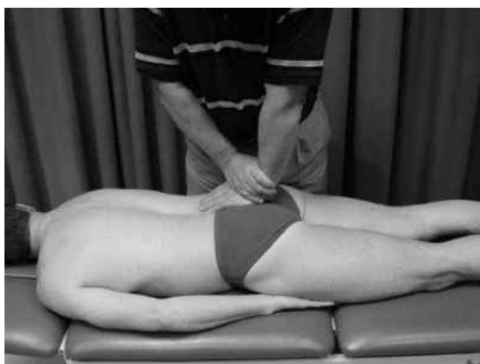
Figure 6. Sacral thrust provocation SIJ test.